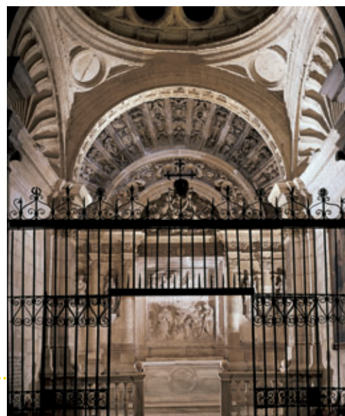
Capilla de Junterotes de la catedral de Murcia.